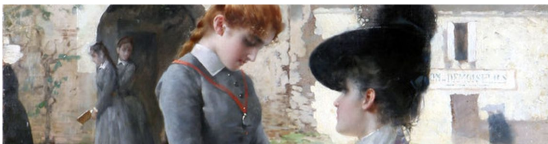
Vittorio Matteo Corcos (1859 - 1933) - Visita al convento , dettaglio

Saluto e apertura Dirigente sindacale Sunas - Centro studi Iris Socialia Docenza master specialistica