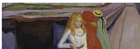
Edvard Munch (1863-1944), Ragazze sul ponte (1902), dettaglio