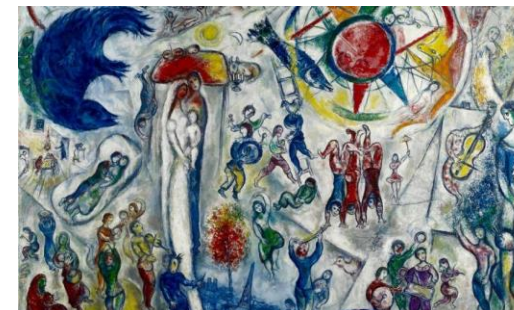
Marc Chagall, La Vie – 1964 – Fondazione Maeght